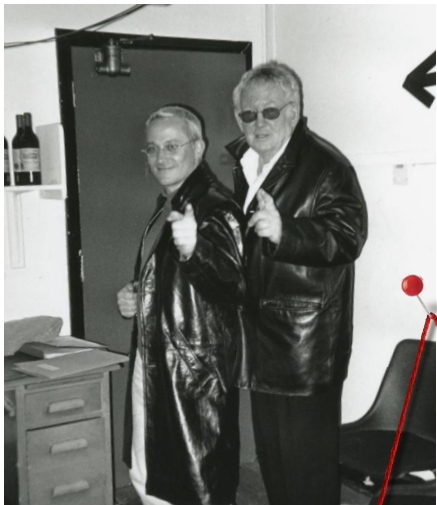
Met Hugo Claus, die andere gigant van de Vlaamse letteren.