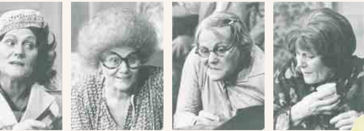
Ze keerde zeven verschillende rollen. Tom Lanoye: 'Het moet één grote verkleedpartij geweest zijn.' © Tom Lanoye