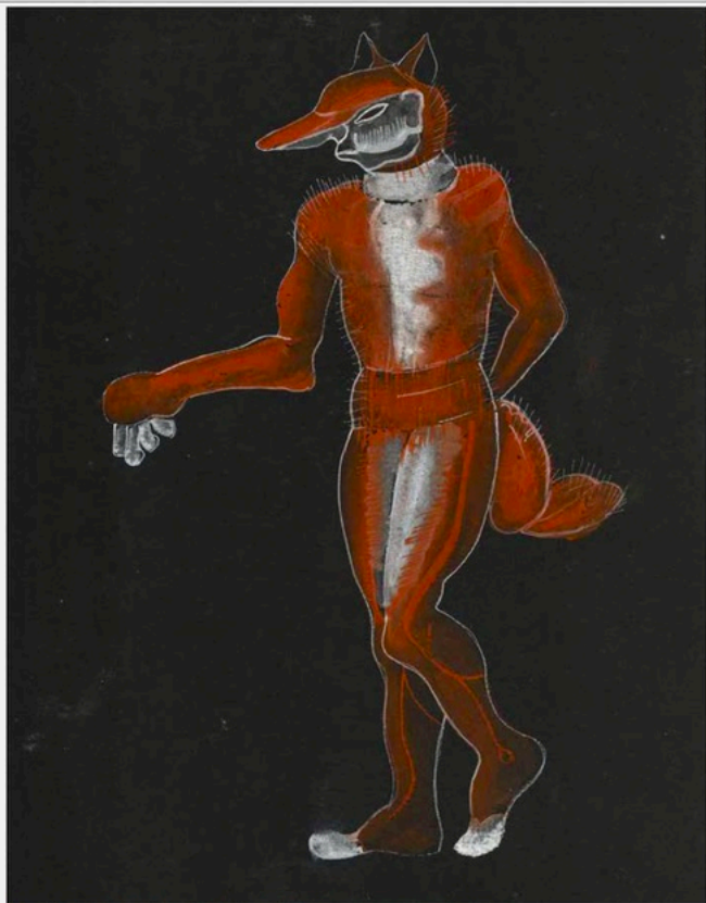
Reinaert de vos. Deze illustratie van Lon Landau uit 1938 sliert de cover van Lanoyes bewerking.

Dit Vlaamse meesterwerk, een satire over macht, seks en geweld, lag haast te wachten op de spozucht van Lanoye.